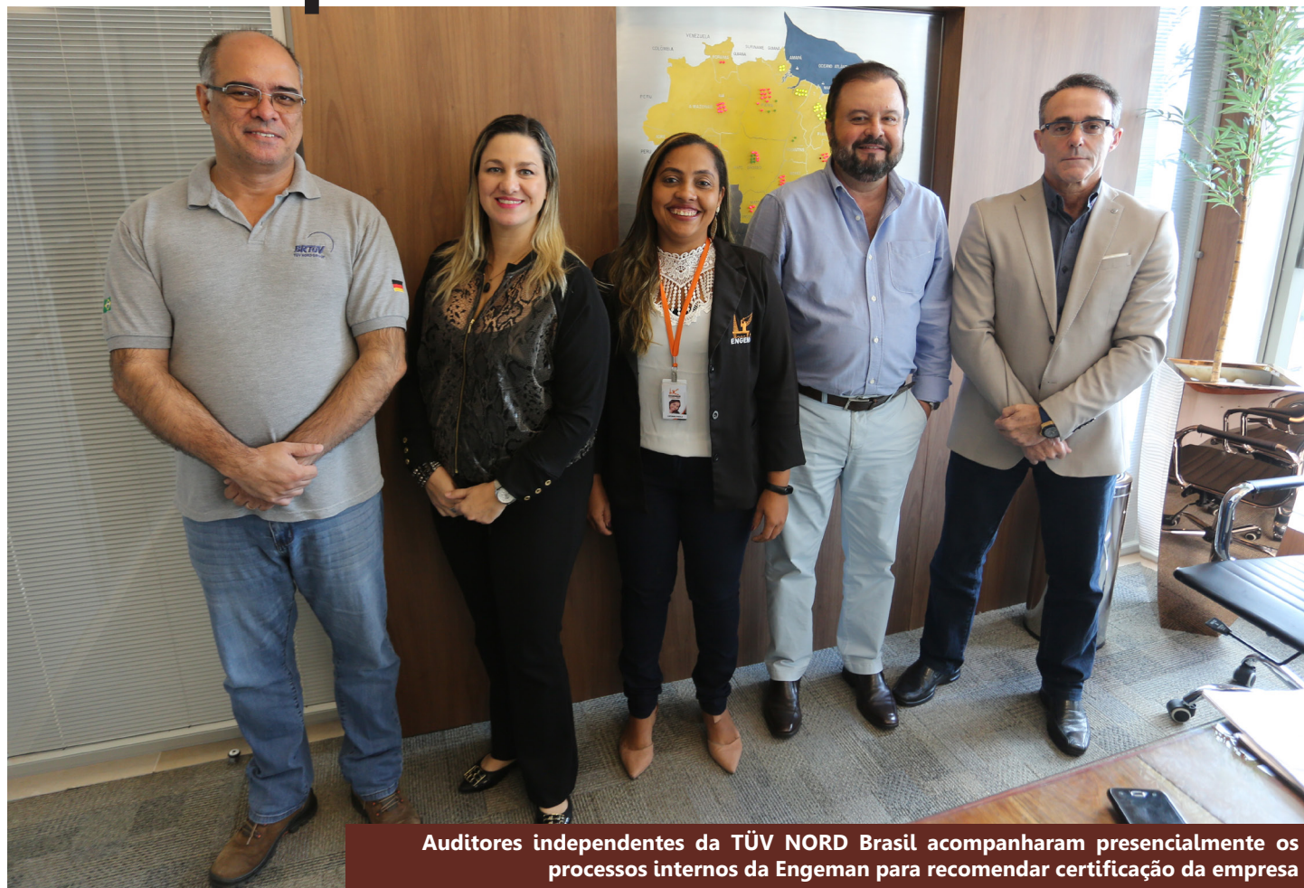
Audidores independentes da TÜV NORD Brasil acompanharam presencialmente os processos internos da Engeman para recomendar certificação da empresa

A Engeman deu outro importante passo para tornar a empresa ainda mais segura e confiável para clientes, fornecedores e colaboradores. Em maio de 2020, conquistou sua quarta certificação internacional ISO. Agora, a Engeman é a única empresa no Norte e Nordeste a deter a certificação ISO 37001, que trata do Sistema de Gestão Antissuborno.