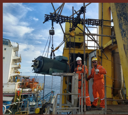
Time da Engeman trabalhando nas mais complexas atividades em diversas plataformas de petróleo